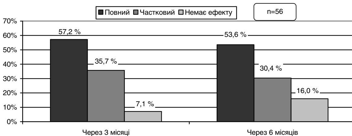
Рис. 1. Антиаритмічний ефект препарату етацизин у хворих із шлуночковою екстрасистолією без тяжких структурних уражень міокарда упродовж 6 місяців лікування.

У результаті аналізу клінічної ефективності етацизину впродовж 3 і 6 місяців лікування антиаритмічний ефект препарату через 3 міс відзначено у 52 (92,9 %) пацієнтів: у 32 (57,2 %) – повний і у 20 (35,7 %) – частковий (рис. 1). Водночас у 4 (7,1 %) пацієнтів, незважаючи на прийом етацизину в дозі 200 мг/добу, антиарит-